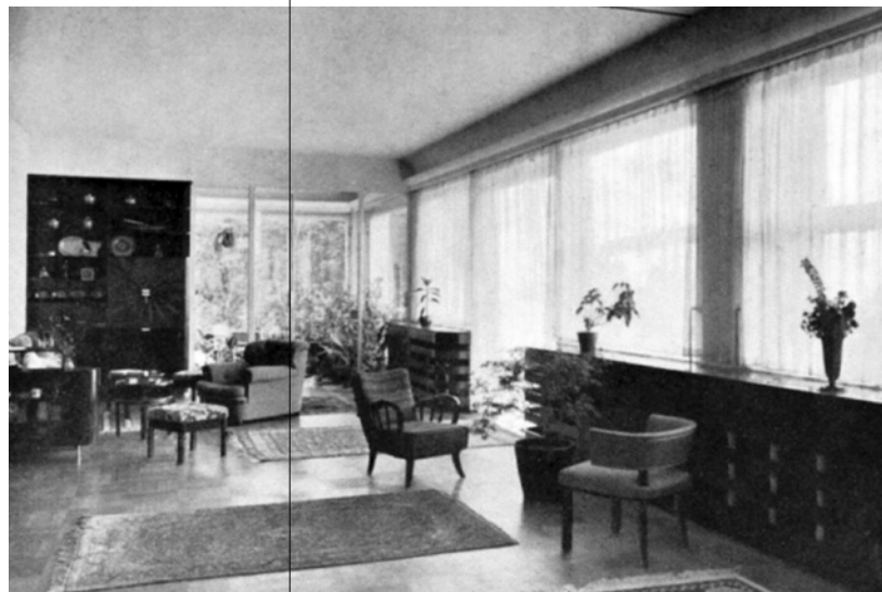
Fotos/Photos: Franz Mayer, abgedruckt in: The Studio , 11. Jg. 1936, S. 43 ff. / Franz Mayer, reprinted in: The Studio , Vol. 11, 1936, p. 43 ff.