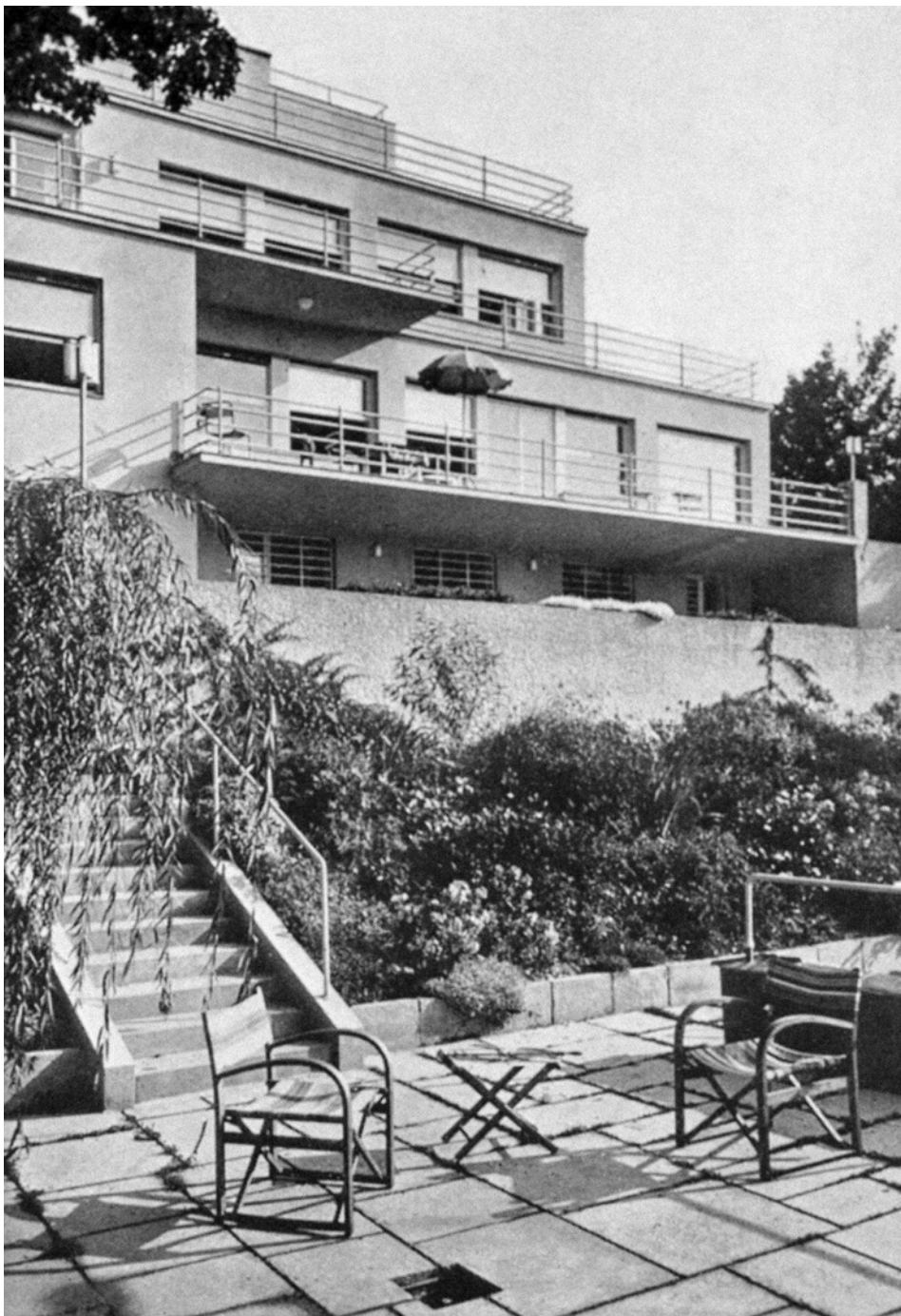
Franz Mayer, abgedruckt in: The Studio, 11. Jg. 1936, S. 43 ff. / Franz Mayer, reprinted in: The Studio, Vol. 11, 1936, p. 43 ff.