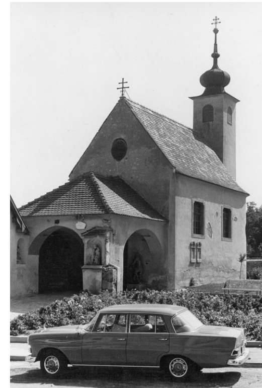
Magdalenenkapelle nach dem Zweiten Weltkrieg, Aufnahme 1964

In den folgenden Jahren wurde der Bau mit straßenseitiger offener Vorhalle und Zwiebeltürmchen reich ausgestattet. An den Pfeilern der Vorhalle sind Steinfiguren der Maria Magdalena und des sitzenden Schmerzensmannes angebracht. Der Kapelleneingang ist von einem Christus an der Martersäule und einer Mater dolorosa flankiert. Vermutlich wurden die beiden letzteren Figuren im 19. Jahrhundert in sekundärer Verwendung an ihren gegenwärtigen Aufstellungs-ort gebracht. Als Schöpfer der Skulpturen wird der Eisenstädter Bildhauer Jakob Hamm vermutet, dessen Wohnhaus „Zu den vier Jahreszeiten“ in der Klostergasse an das Wohnhaus der Magdalena Frumwald grenzte, mit der er – ebenso wie Joseph Haydn – jahrelang einen Streit vor dem Eisenstädter Stadtrat austrug. Die streitbare Frau sollte auch weiterhin Sorge für ihre Stiftung tragen und widmete dem Sakralbau im Dezember 1769 eine Reliquienmonstranz. In der älteren Literatur werden außerdem, neben einem der Maria Magdalena geweihten Hochaltar, zwei Seitenaltäre, darunter ein Kreuzaltar mit den Figuren der Maria und des Johannes, erwähnt. Diese Einrichtungsteile sind gegenwärtig verschollen.