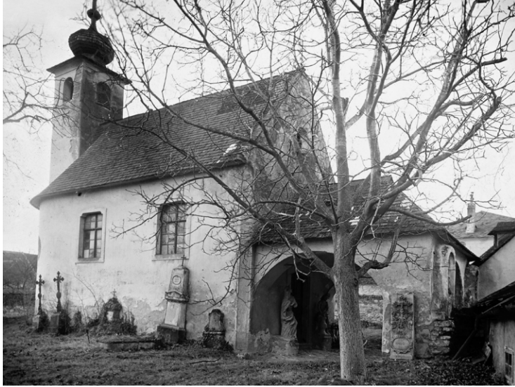
Magdalenenkapelle, Ansicht von ca. 1920