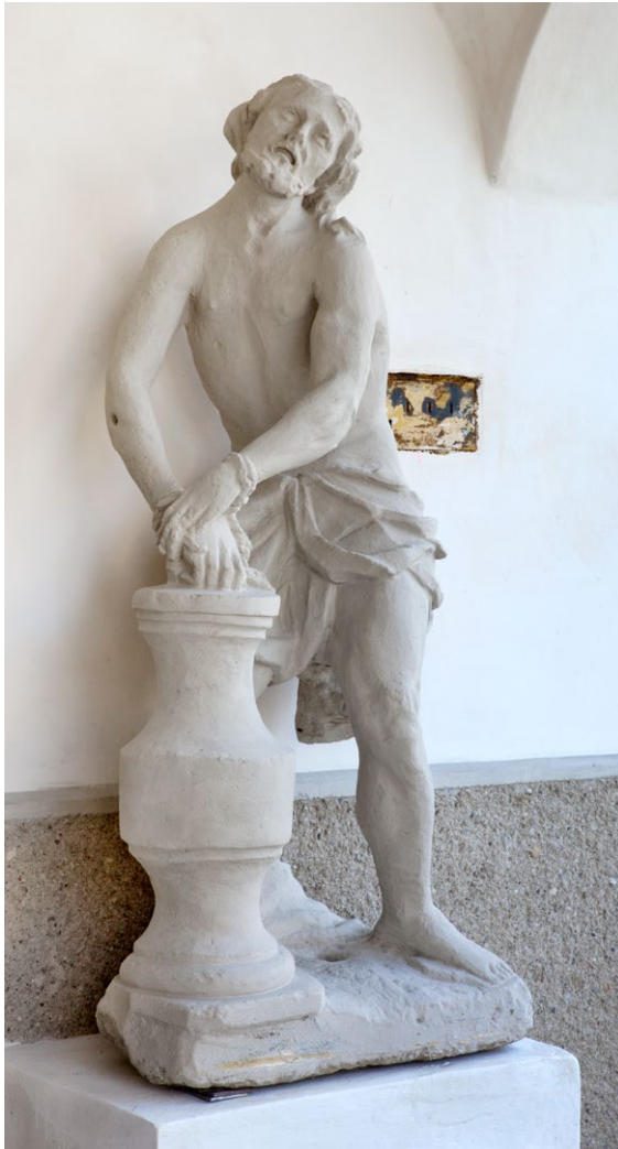
Christus an der Martersäule nach Restaurierung, 2019