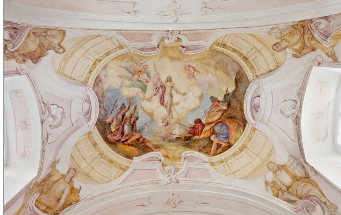
Gewölbejoch mit Bildmedaillon, 2022

Im ersten Joch ist ein zentrales Thema barocker Deckenmalerei zu sehen, die „Assumptio Mariae“, die leibliche Aufnahme Mariens als „Ersterlöste“ in den Himmel: Während die auf einer Wolkensäule ruhende, in reiches blaues Gewand gehüllte Maria von Engeln in den Himmel getragen wird, bleiben die Apostel und Maria Magdalena vor dem leeren Grab zurück. In den Zwickeln sind die tonig gehaltenen Kirchenväter Gregor, Augustinus, Hieronymus und insbesondere Ambrosius als Patron der Marienverehrung erkennbar. Im an die Apsis anschließenden Gewölbejoch öffnet sich die illusionistische Architektur in eine Darstellung aus der Passion mit dem auferstandenen Erlöser über dem leeren Grab und den auf der Erde liegenden Grabwächtern. In der Rechten hält Christus die Fahne als Symbol des Sieges über den Tod, die Linke weist zu den schlafenden Wächtern. Ein Wolkenturm mit Engelsfiguren schließt die Darstellung ab. In den Zwickeln sitzen auf Konsolen die Evangelisten Johannes, Markus, Matthäus und Lukas.