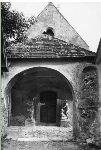
Magdalenenkapelle, Vorhalle mit Schindeldeckung, Aufnahme ca. 1920

In den folgenden Jahren wurde der Bau mit straßenseitiger offener Vorhalle und Zwiebeltürmchen reich ausgestattet. An den Pfeilern der Vorhalle sind Steinfiguren der Maria Magdalena und des sitzenden Schmerzensmannes angebracht. Der Kapelleneingang ist von einem Christus an der Martersäule und einer Mater dolorosa flankiert. Vermutlich wurden die beiden letzteren Figuren im 19. Jahrhundert in sekundärer Verwendung an ihren gegenwärtigen Aufstellungs-ort gebracht. Als Schöpfer der Skulpturen wird der Eisenstädter Bildhauer Jakob Hamm vermutet, dessen Wohnhaus „Zu den vier Jahreszeiten“ in der Klostergasse an das Wohnhaus der Magdalena Frumwald grenzte, mit der er – ebenso wie Joseph Haydn – jahrelang einen Streit vor dem Eisenstädter Stadtrat austrug. Die streitbare Frau sollte auch weiterhin Sorge für ihre Stiftung tragen und widmete dem Sakralbau im Dezember 1769 eine Reliquienmonstranz. In der älteren Literatur werden außerdem, neben einem der Maria Magdalena geweihten Hochaltar, zwei Seitenaltäre, darunter ein Kreuzaltar mit den Figuren der Maria und des Johannes, erwähnt. Diese Einrichtungsteile sind gegenwärtig verschollen.