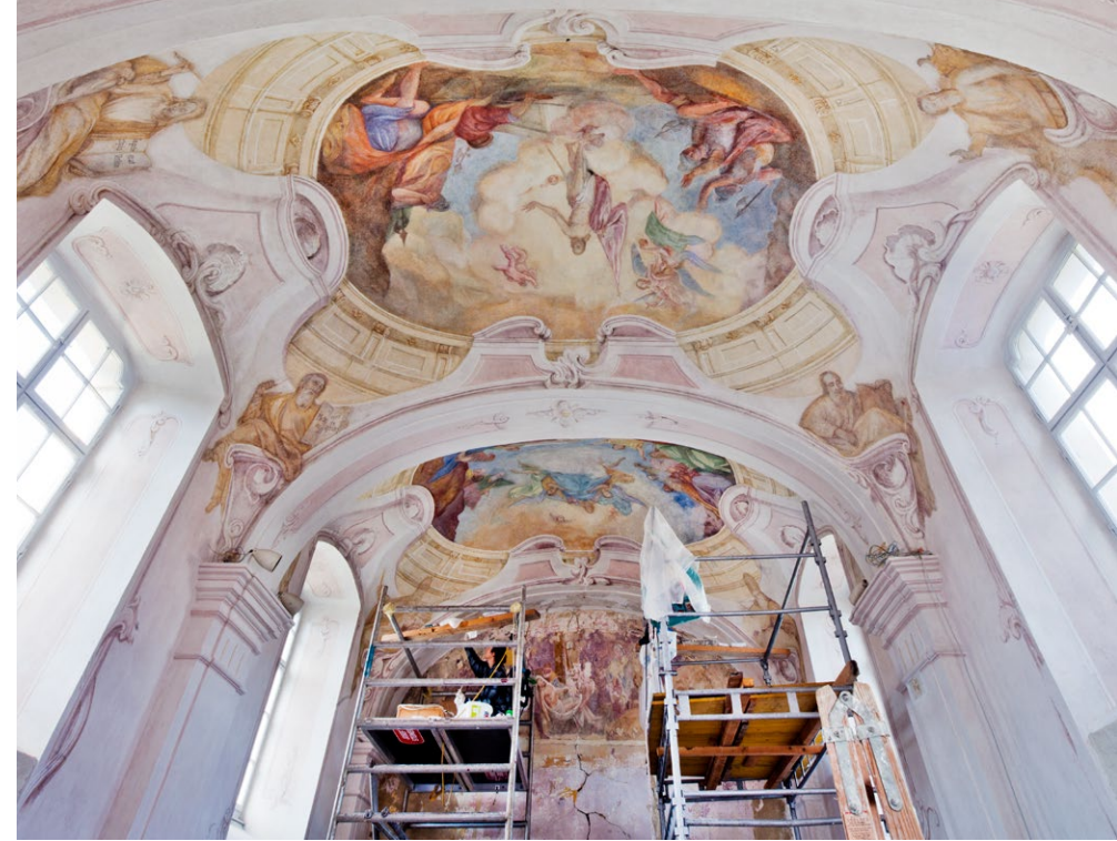
Die Wandrestauratorin bei ihrer Arbeit, 2022

Im Zuge der seit 2018 durchgeführten Maßnahmen konnten aufgrund intensiver restauratorischer Befundungen das barocke Erscheinungsbild der Kapelle und die reiche malerische Ausstattung mit Quadraturmalerei und Bildmedallions aus den 1770er Jahren wiederhergestellt werden. In mühevoller Handarbeit war der Dispersionsanstrich vom Restaurator:innenteam Zentimeter für Zentimeter im gesamten Innenraum entfernt und die freigelegte Malerei restauriert und retuschiert worden. Aufgrund der Pandemie verzögerte sich die Fertigstellung bis 2023. Die Arbeiten erfolgten in enger Abstimmung zwischen Bundesdenkmalamt, dem Bauamt der Diözese, der für das Gebäude zuständigen Dompfarre und der Pfarrgemeinde sowie den Handwerks- und Restaurierungsbetrieben. Ein bemerkenswertes Beispiel spätbarocker Kirchenkunst im pannonischen Raum ist damit wieder in seiner ursprünglichen Schönheit erstanden.