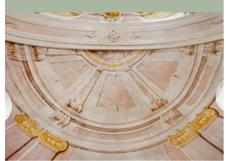
Apsis mit Quadraturmalerei, 2022

Bisher konnte keine Zuschreibung an einen Künstler erfolgen, doch weist die Qualität der Malerei auf einen Künstler aus dem Umkreis der Fürsten Esterházy hin. 1785 sollte die Stifterin ihre letzte Ruhestätte in einer Gruft zu Füßen der Auferstehung Christi finden. Über die Jahrhunderte veränderte sich die Umgebung der Magdalenenkapelle massiv. In der zweiten Hälfte des 19. Jahrhunderts wurde der Friedhof aufgelassen. Die bis an die Kapelle reichende Häuserzeile musste nach dem Zweiten Weltkrieg dem Straßenausbau und dem großzügig dimensionierten Kriegerdenkmal weichen, dessen weite Kolonnade direkt an die Kapelle andockt. In dieser Zeit wurde auch das bis dahin weitgehend ursprünglich erhaltene Friedhofskirchlein umfassend umgestaltet: die spätbarocken Malereien wurden überstrichen, die drei Altäre entfernt und der Boden durch Terrazzoplatten ersetzt. Auch die Lage an der verkehrsreichen Neusiedler Straße trug dazu bei, dass die Bedeutung der Kapelle allmählich vergessen wurde.